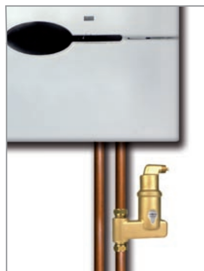
Een luchtafseparator van Spirotech haalt continu lucht uit de installatie